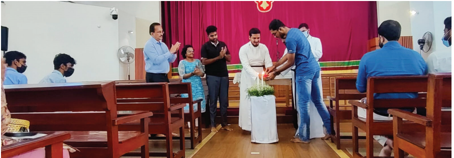
Yuvajana Sakhyam Pravarthana Uthkadanam