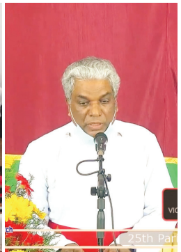
25th Edavaka Dinam