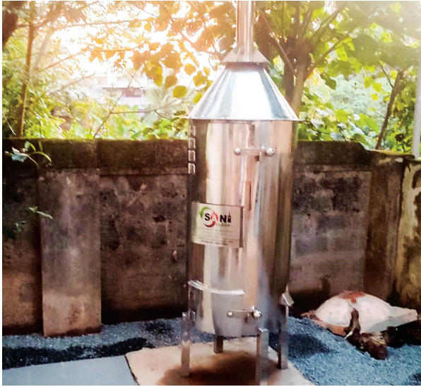
Newly installed incinerator in our church