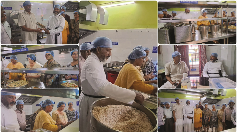
Edavaka Mission Visit and Serve at District Hospital Ernakulam