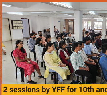
YFF Cottage Prayer