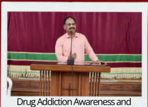
Drug Addiction Awareness and Prevention.