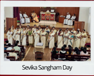
Sevika Sangham Day