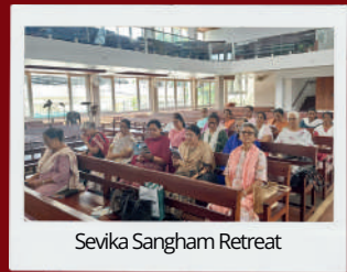
Sevika Sangham Retreat