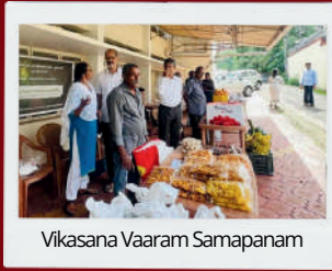
Vikasana Vaaram Samapanam