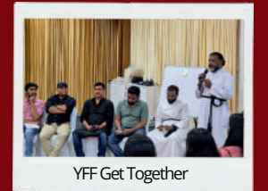
YFF Get Together