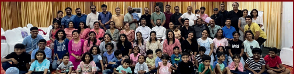
YFF - Get Together At Nihara Resort & Spa, Kadamakudy Island, Kochi