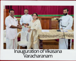
Inauguration of Vikasana Varacharanam