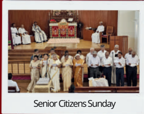
Senior Citizens Sunday