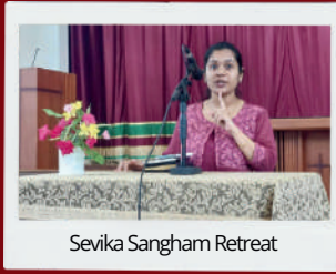
Sevika Sangham Retreat