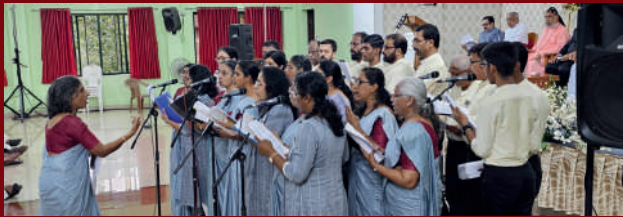
31st Santhi Prabhashanam at Santhigiri Ashram, Aluva Our choir had the privilege of singing both the opening and final hymns. It was a beautiful and memorable experience for everyone involved