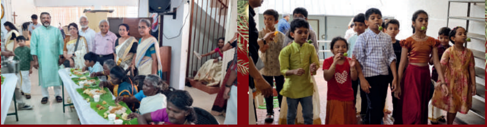
പൂവിളി - Onam Celebration of the Christos Family