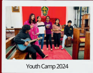
Youth Camp 2024