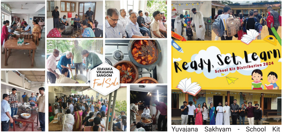
Edavaka Vikasana Sanghom - Food Sale