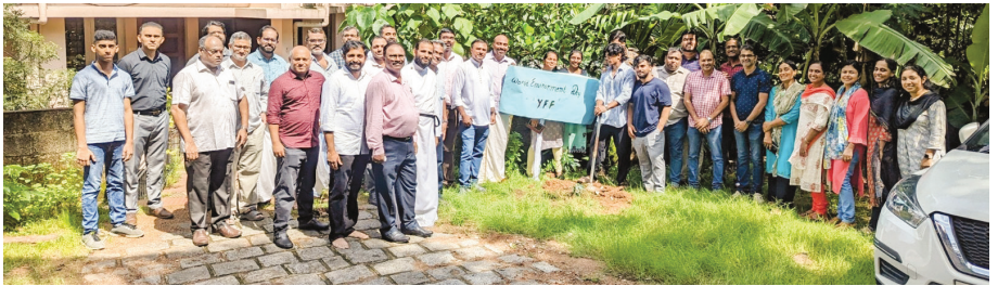
YFF - World Environment Day