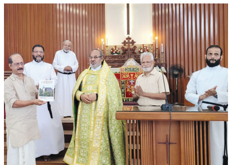
Parish Supplementary Directory Released