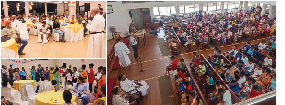
Choir - Evening Out