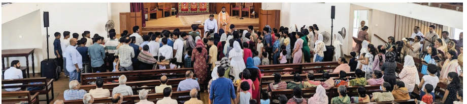
Sunday School - New Academic Year - Students & Teachers Dedication