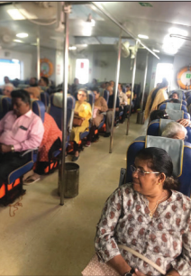
Senior citizens' boat trip on January 20, 2024.