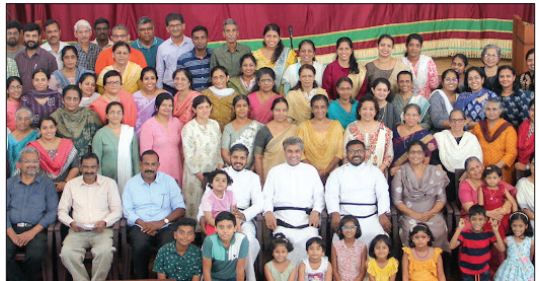
Centre Teacher's Retreat