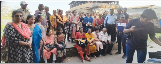
Sevikasangom conducted a boat ride on February 9th in Alleppey for its members and everyone enjoyed it.