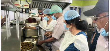
Edavaka Mission - Visit to Government Hospital Ernakulam