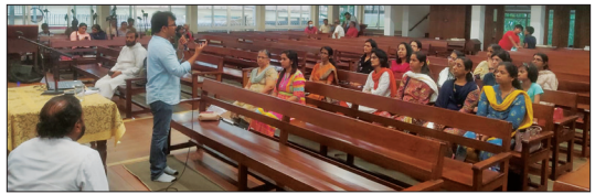
Sunday School Teacher's Retreat