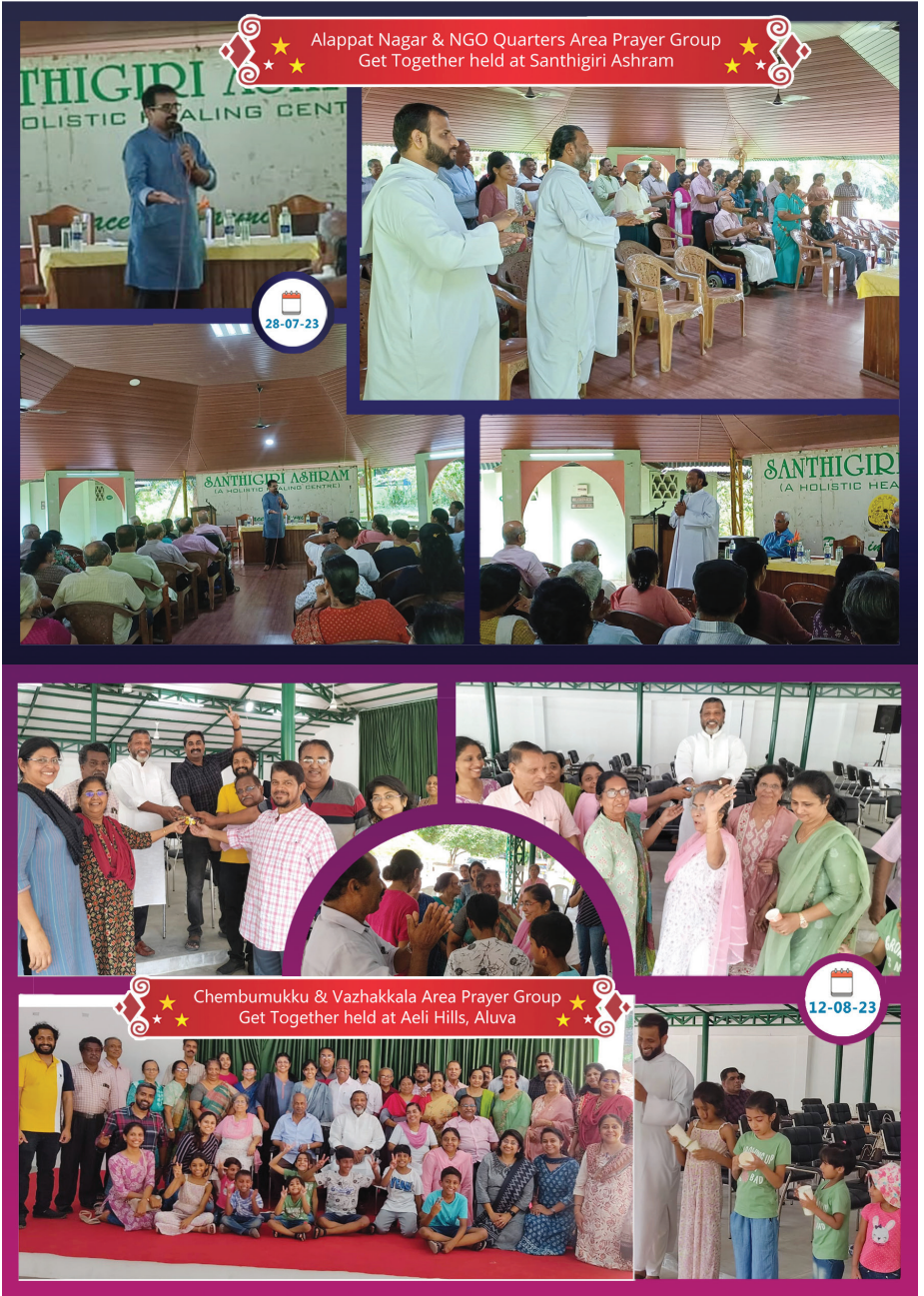
Alappatt Nagar & NGO Quarters Area Prayer Group Get Together held at Santhigiri Ashram