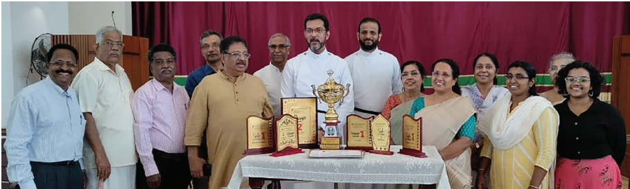
The Voluntary Evangelistic Association (Edavaka Mission) members with Prizes and Trophy received for Ernakulam Center Competition