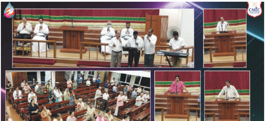
Parish Convention November 17-19