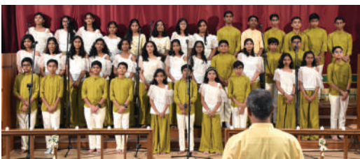
Carol Service on 17.12.2022