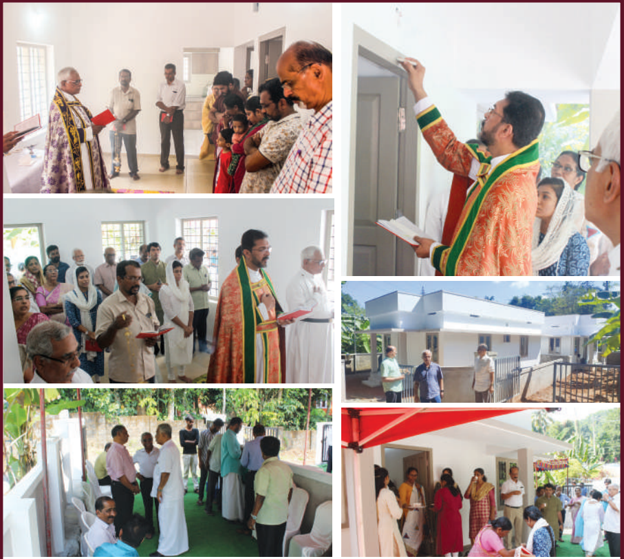
Home for homeless dedication on 21.12.2022