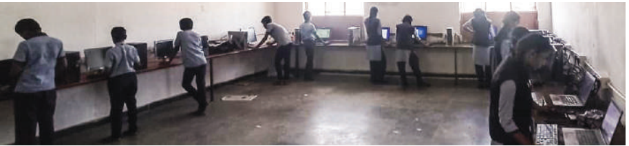
The computers that we handed over to St. Thomas School, Manthralayam during our Parish mission tour in August is now set up and being used.