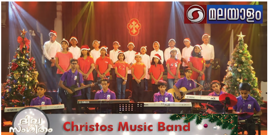
Christos Music Band, an initiative of Christos Mar Thoma Church telecasted on Doodardshan National Network (Malayalam) on 24th December 2022 at 8.00 am.