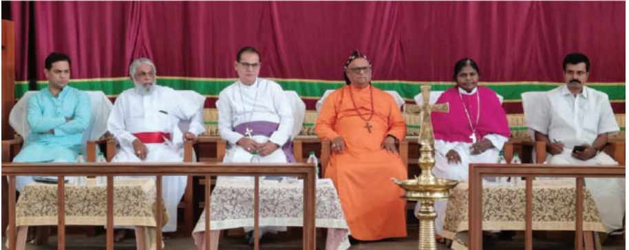
The inauguration of the Silver Jubilee celebration of Communion of Churches in India held at our church on 12.11.2022