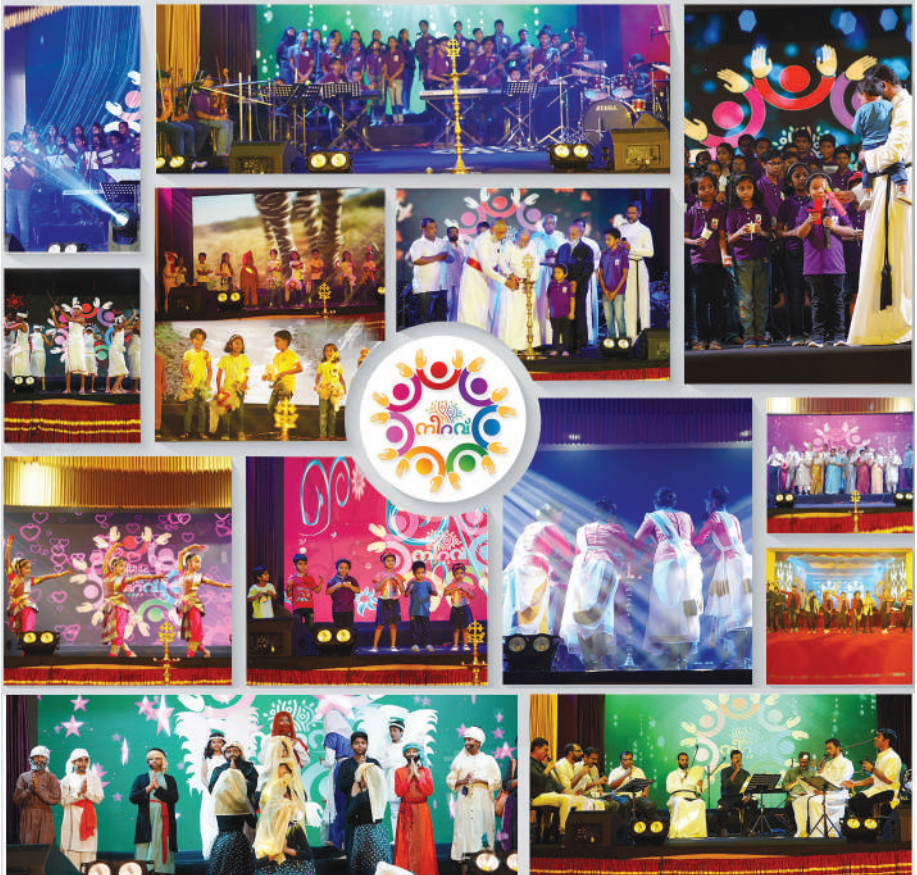
Niravu by Young Family Forum on 26.11.2022 at Marthoma Public School