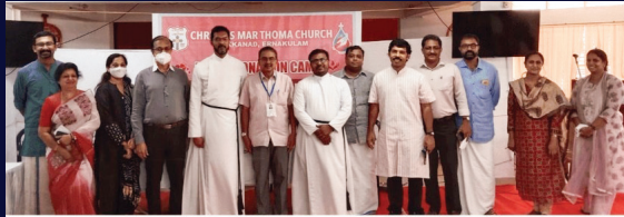
Blood donation camp organised on 13.03 2022 at Christos Marthoma Church by our Palliative Team and Young Family Forum