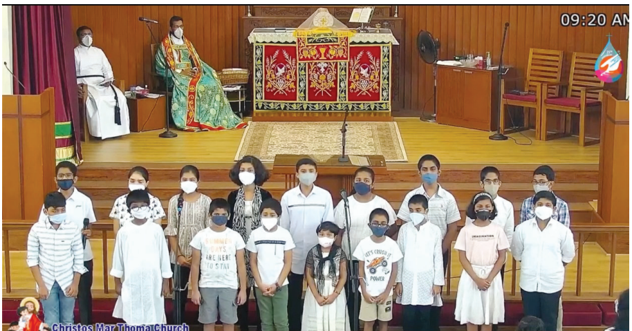
World Sunday School celebration.