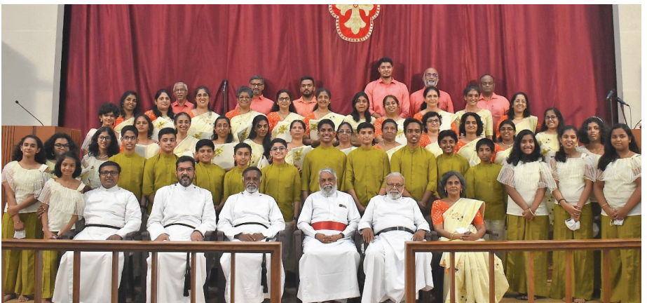
Senior and junior Christmas Carol choir members with Achans

May the Lord's blessings guard and guide you all the way!